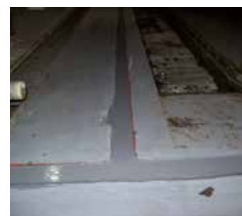
Reparada con Belzona 4521

Si necesita más información, comuníquese con el representante de Belzona de su localidad: