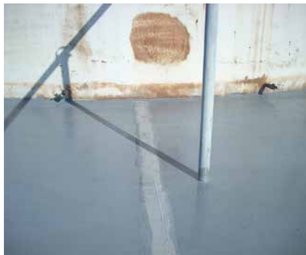
Empleado para reacondicionar juntas defectuosas en área de contención

Se aplica manualmente, sin necesidad de trabajo en caliente ni herramientas especiales, reduciendo el tiempo de inactividad.